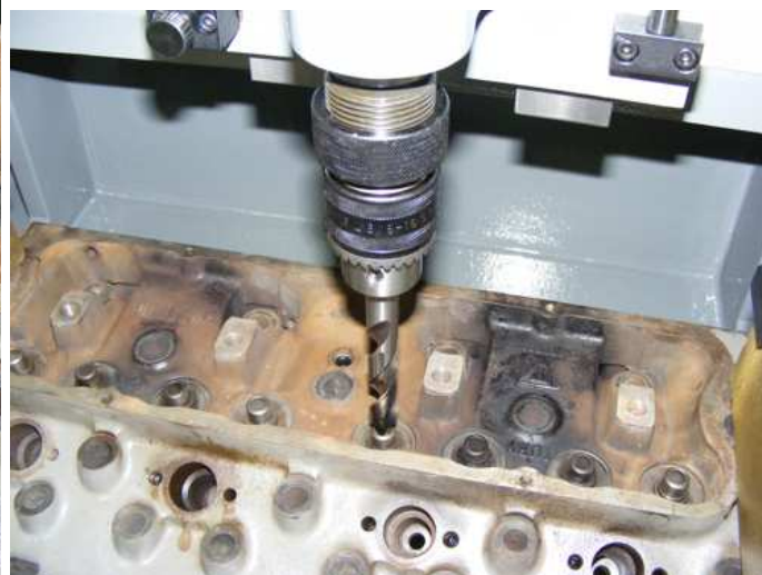
Broca dentro da guia